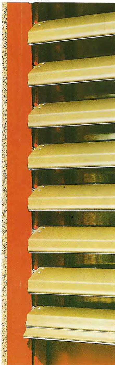
Posición de bajada